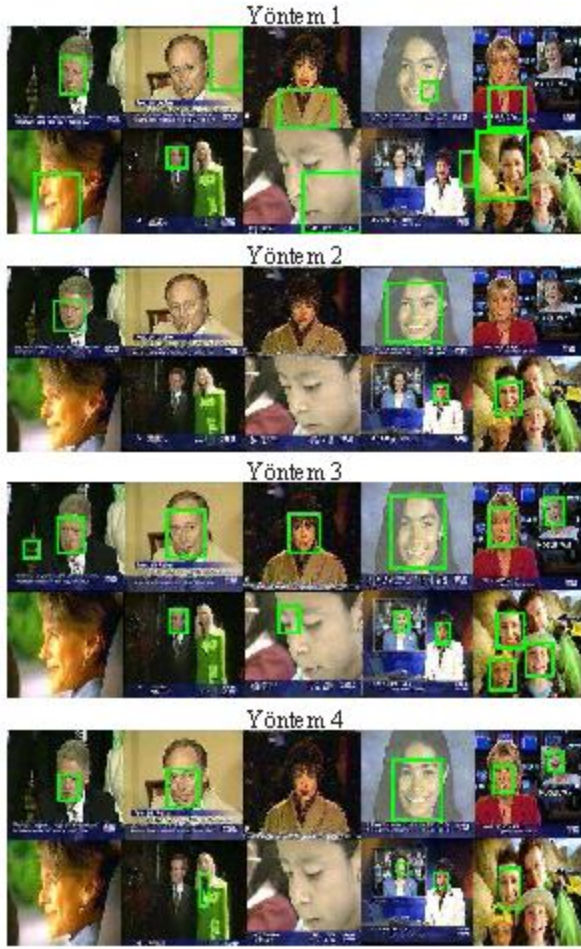
Şekil 3: Her bir yöntem tarafından çıkarılan doğru yüz bölgeleri.

arasındaki küçük bir çakışma dahi doğru olarak değerlendirilmektedir. Oysa çakışma yüzdesi de yöntemin başarısı hakkında oldukça önemli bir etkidir. Bu değerlendirmenin yapılabilmesi amacıyla Şekil 4'te gösterildiği üzere çakışan bölge B, doğru yüz bölgesinde geride kalan kısım A, bulunan yüz bölgesinde geride kalan kısım ise C olarak adlandırılmış ve B/(A+B) ve B/(B+C) oranları hesaplanmıştır. B/(A+B) var olan bir yüzün ne kadar doğrulukla bulunabildiğini, B/(B+C) oranı ise yöntemin ne kadar doğrulukla bir yüzü bulabildiğini göstermektedir. Şekil 5'de yöntemlerin bu oranlara göre başarı yüzdelilerinin dağılımını göstermektedir. Bir yöntemin başarısı grafiklerin ne kadar sağa (büyük yüzdelere) yakın olduğuna bağlıdır.