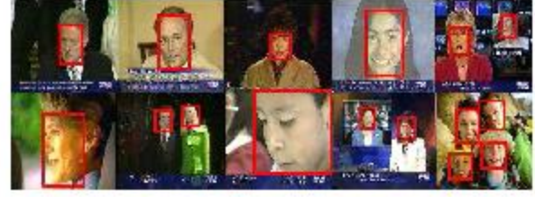
Şekil 2: Elle etiketlenmiş doğru yüz bölgeleri.

Ten bulma tabanlı yöntemler yüz bulmada oldukça sık kullanılmaktadır. Başarı oranları diğer yöntemlere göre daha düşük olmasına rağmen, karşılaştırılabilir bir taban çizgisi oluşturulabilir ve ileniki çalışmalarda diğer yöntemlerle birleştirebilmesi için iyi ve kötü yanlarını görebilmek amacıyla seçilmiştir. Bu çalışmada [10]’da tanımlanan ten rengi tabanlı yüz bulma yöntemi kullanılmıştır. Bu çalışmada RGB renk uzayının ışık parlaklığına olan hassaslığı nedeniyle RGB renk değerleri YCbCr uzayına çevrilmiştir. Yapılan araştırmalarda ve veri arşivinde yapılan incelemeyle ten renginin Y bileşenine bağlı olmadığı, Cb ve Cr değerlerinin ise ten rengi için küçük bir aralıkta kümelendiği görülmüştür. Kullanılan yöntem bu verilerden yola çıkılarak, tek bir Gauss modeli kullanılarak geliştirilmiştir.