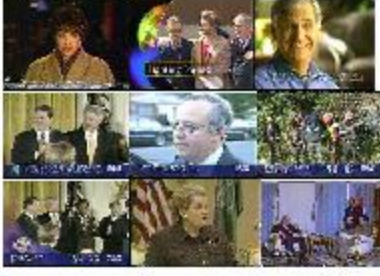
Şekil 1: Videodan yüz örnekleri